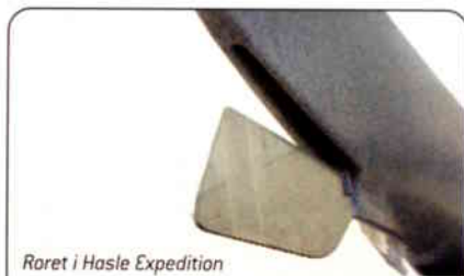
Roret i Hasle Expedition kan trekkes opp i en slisse i skroget. Opptrukket kan man faktisk slepe kajakken med det rustfrie rorbladet i bakken eller på steingrunn.