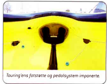
Touring'ens fotstøtte og pedalsystem imponerte.

Arne Hasle AS har 40 forhandlere rundt om i landet, og pris og tilbud vil variere etter tidsperiode, innkjøp og pakkeløsninger. Deres største forhandler, Ut i Naturen AS i Stavanger, har for eksempel, når dette skrives, gjort storinnkjøp og kan tilby Expedition pakkeløsning for knallprisen 11.200 kroner inkludert åre, spruttrekk og vest.