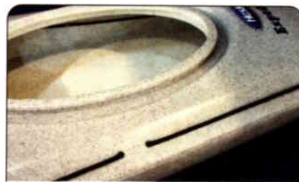
Festesnorene på dekk er trukket gjennom integrerte støpte føringer i skroget for å unngå påskrudd knaster.

Hasle Expedition er av god konstruksjon og et godt alternativ for den litt øvede som vil ha en trygg og solid PE-kajakk med mange gode praktiske løsninger.