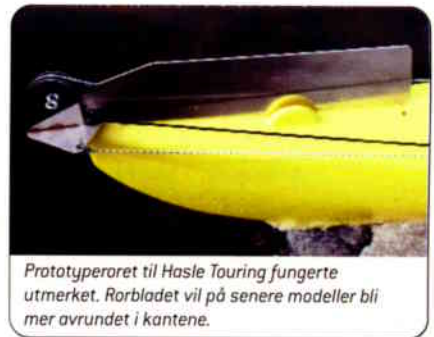
Prototypororet til Hasle Touring fungerte utmerket. Rorbladet vil på senere modeller bli mer avrundet i kantene.