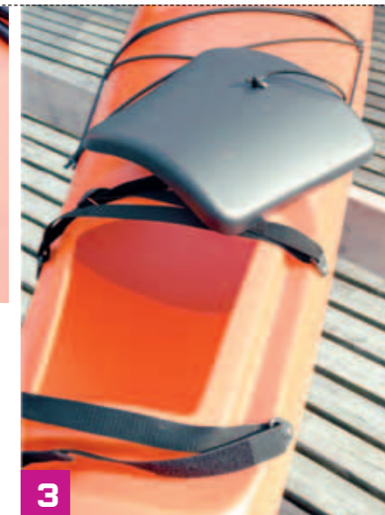
1. Uslåelig sittekomfort. 2. Brukbare bærehåndtak med godt dekkfeste. 3. Praktiske lukelokk som holder tett. 4. Dette roret gjør jobben sin.