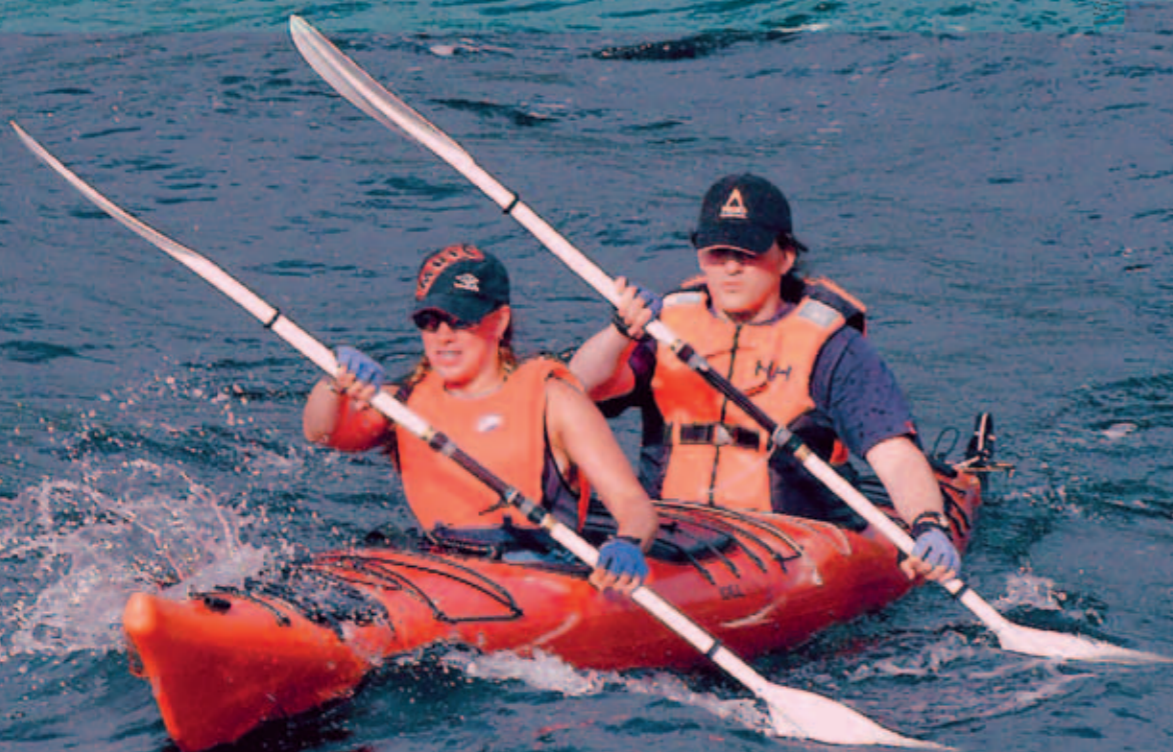
Kajakken oppfører seg fint i sjøen under alle forhold.

Når så du sist en toerkajakk på fjorden? Denne båttypen representerer bare noen få prosent av det totale kajakksalget. Egentlig litt urettferdig, for båttypen kan på mange måter tilføre padlesporten en ekstra dimensjon.