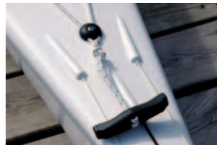
Båtene har gode bærehåndtak.