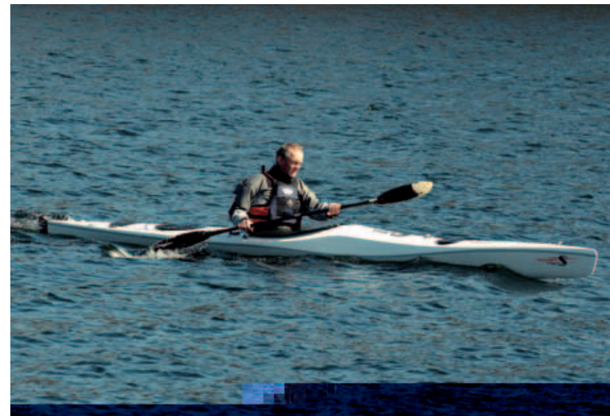
Baugen på Commander reiser seg litt i stor fart.

Begge kajakkene har en uvanlig høy byggekvalitet. Rent teknisk finner vi ikke en eneste ting å sette fingeren på. Alt er nærmest perfekt utført. Svarte og kjedelige lukelokk på såpass kostbare båter har vi derimot ikke sansen for. Extreme Type R bærer ikke navnet for ingenting. Den ER ekstrem og fordrer en uvanlig dyktig padler. Balansen må sitte i ryggmargen hvis det skal kjempes om topplassering over lange strekk i litt vind og sjø. For de få utvalgte er den til gjengjeld så «giftig» at andre kajakkere kan få tøff konkurranse. Båten kan uten tvil komme til å vinne mange løp. Padlere som ikke påberoper seg å være særdeles dyktige kan nøye seg med å lese testen. Commander Type S fremstår som et interessant alternativ for ekspedisjoner og turer med mye last. Helt tom kan den føles nervøs med sterk vind på skrå bakfra. I likhet med