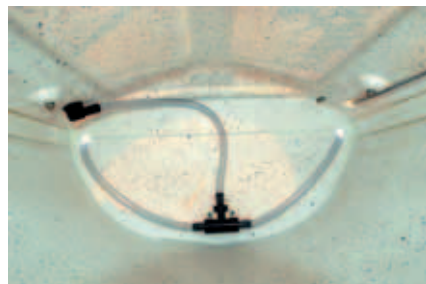
Slangene til lenspumpen i Extreme fotografert i det største lasterommet. Skottet vender mot sitsen.