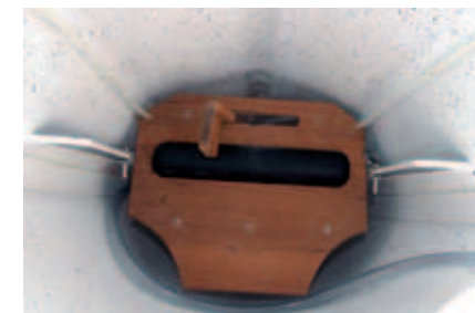
Extreme Type R har sparkebrett og styrepinne av racingtypen.