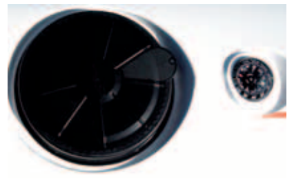
Kajakker i en såpass høy prisklasse fortjener stiligere luker.