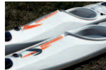
Reval leverer kvalitet fra baug til akter.

de beskjedne bølgene. Kajakken er uvanlig lang og beveger seg over dem med verdighet og eleganse. Skal den yte sitt beste i litt urolig sjø er det en stor fordel at padleren har fartstid fra konkurransepaddling i K-1. Min egen erfaring med litt ranke treningsracere er ikke nok til å kunne takle en slik utemmet hingst tilfredsstillende når det blåser opp. Båten er konstruert for å vinne havrace og maraton. Derfor passer den best for en ekspert. Commander Type S er lettere å kontrollere og vil dermed kunne tilfredsstille en større padlerskare. Primærstabiliteten er høyere og den sekundære grenser mot mid-