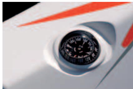
Begge kajakkene er standardutrustet med kompass.