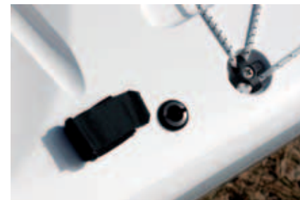
Vann pumpes ut via dekket i Extreme. Begge har fester til åren for selvredning.