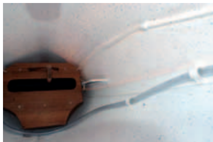
Begge båtene kan leveres med sparkebrett. Her fra Extreme.